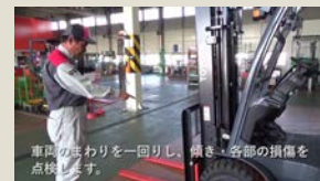
安全講習動画イメージ

フォークリフトは便利な機械ですが、危険もいっぱい。取り扱いには十分気をつけたいものです。最近ではyoutubeで「フォークリフト 事故」と検索すると、たくさんの事故事例を見ることができるようになりました。これを他山の石として、安全作業を心がけたいものですね。Youtubeと言えば、なんと弊社公式チャンネルもあるんです!安全講習動画や珍しい機器の動作風景、過去のCMなどもアップロードされています。ぜひぜひご覧ください!