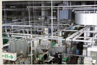
床にスペースがない作業場

広い工場、ライン作業、倉庫の開口部、ゴルフ練習場など、空間全体を冷房しにくい場所にお使いいただけるスポットクーラー「インスパック」。作業者のいる必要なスポットだけを集中冷房できるので、経済的で無駄がありません。キャスターで可動する床置きタイプなら設置場所は自由自在、即日冷房環境が整います。